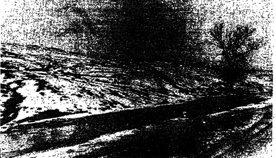
طريق ضهر البيدر سائكة .. ولا سيارات